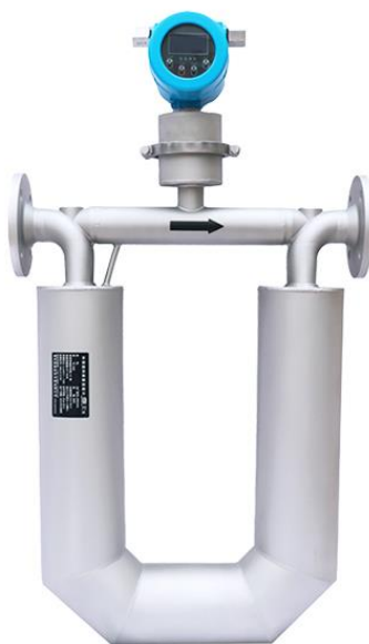
Рисунок 1 – Внешний вид расходомеров массовых кориолисовых K200

Общий вид расходомеров представлен на рисунке 1.