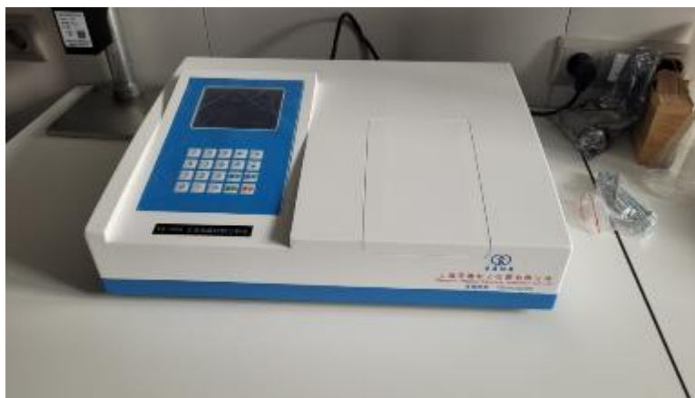
Рисунок 1 – Общий вид анализатора рентгенофлуоресцентного YZ-6300

Общий вид анализатора представлен на рисунке 1.