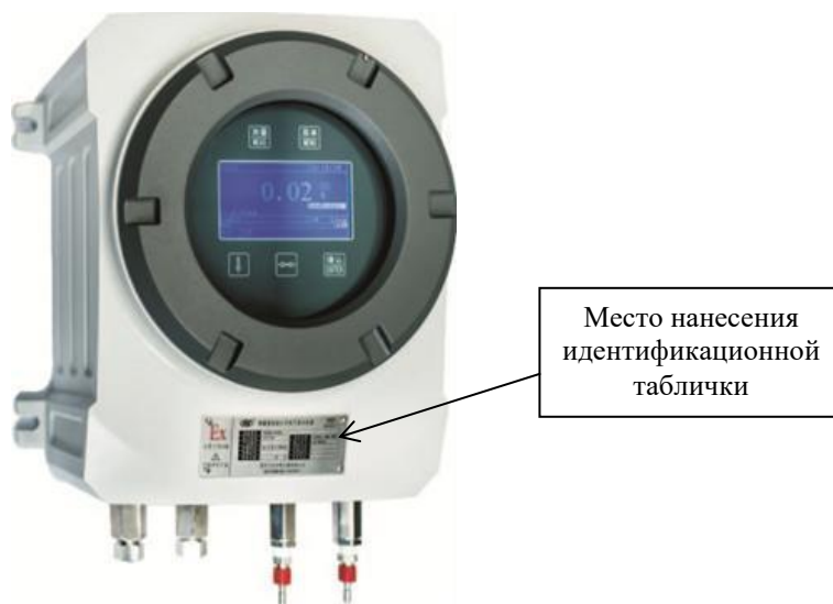
Рисунок 1 – Общий вид газоанализаторов РА600

Нанесение знака поверки на газоанализаторы не предусмотрено.