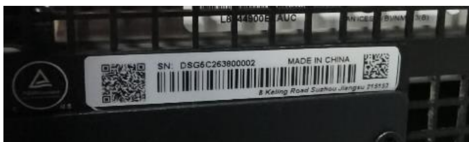
Рисунок 3 – Фрагмент задней панели генераторов с этикеткой