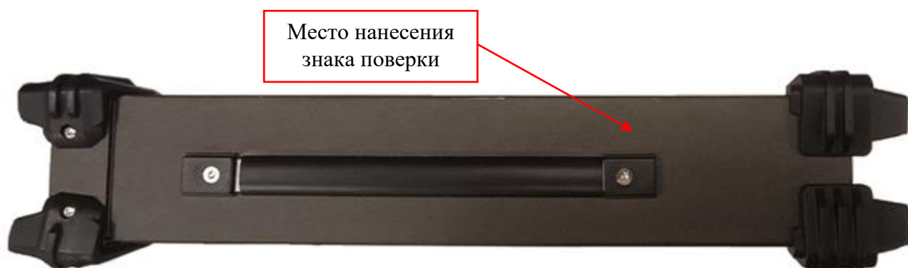
Рисунок 5 – Общий вид генераторов, боковая панель