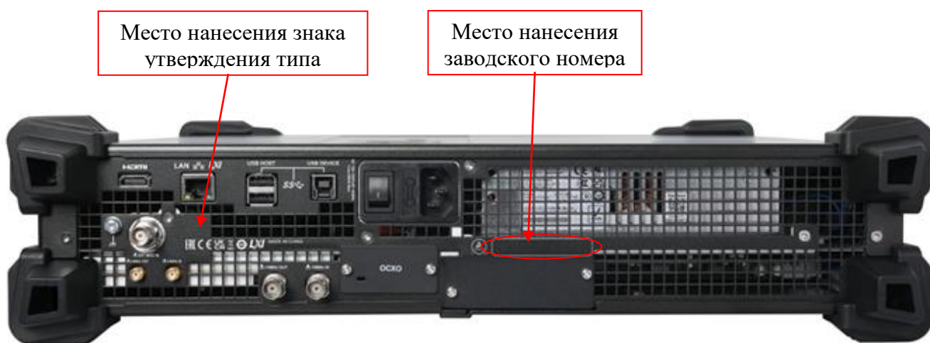
Рисунок 2 – Общий вид генераторов, задняя панель