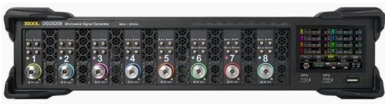
Рисунок 1 – Общий вид генераторов, передняя панель

Знак поверки наносится на боковую панель генераторов в виде самоклеящейся наклейки (рисунок 5).