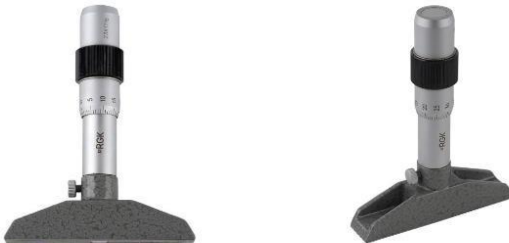
Рисунок 1 – Общий вид глубиномеров