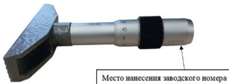
Рисунок 2 – Место нанесения заводского номера