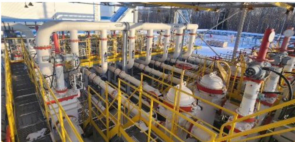
Рисунок 1 – Общий вид СИКН

Общий вид СИКН представлен на рисунке 1.