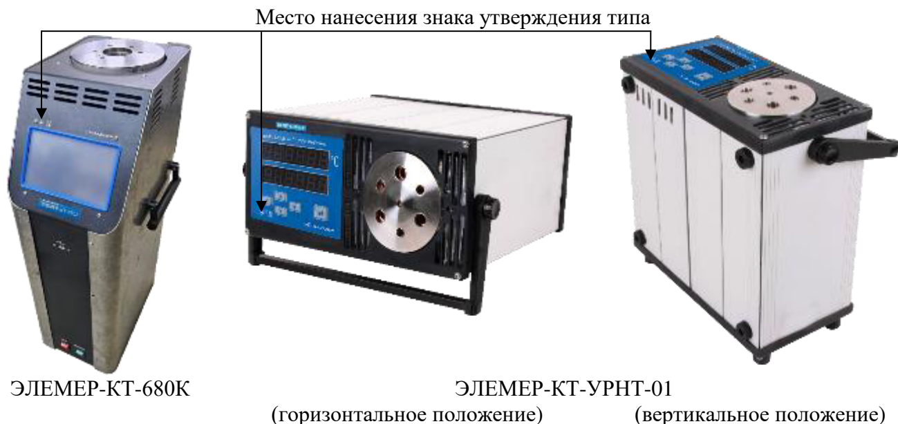
Рисунок 1 – Общий вид калибраторов с указанием мест нанесения знака утверждения типа