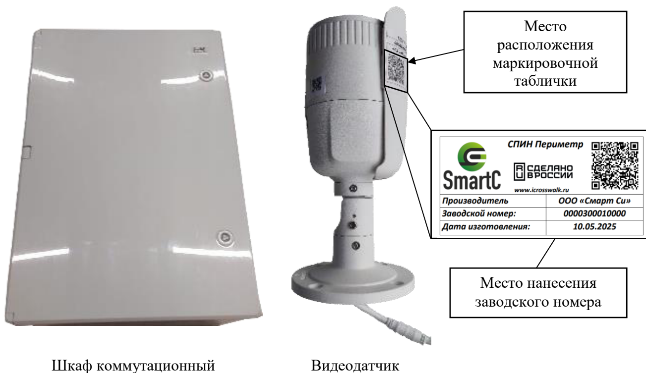
Рисунок 1 – Общий вид шкафа коммутационного и видеодатчика, входящих в состав Систем, место расположения маркировочной таблички и заводского номера на видеодатчике

Места нанесения пломбировки, место расположения маркировочной таблички с указанием места нанесения заводского номера и знака утверждения типа в шкафу коммутационном приведены на рисунке 2.