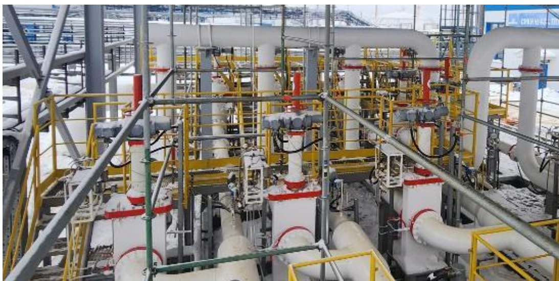
Рисунок 1 – Общий вид СИКН

Общий вид СИКН представлен на рисунке 1.