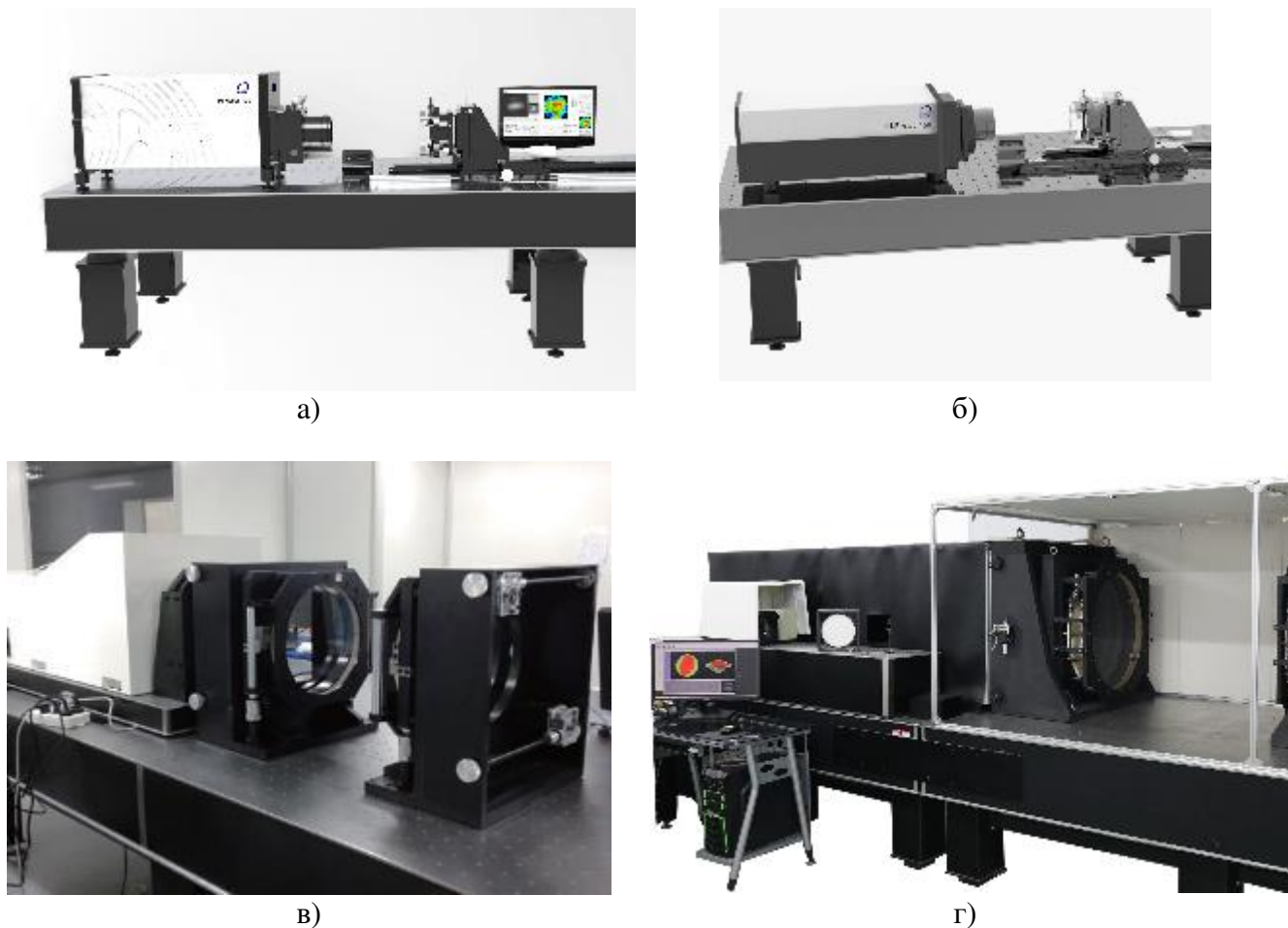
Рисунок 1 – Внешний вид интерферометров лазерных U-Optics IH-Fizeau: а) U-Optics IH-Fizeau 100; б) U-Optics IH-Fizeau 150; в) U-Optics IH-Fizeau 300; г) U-Optics IH-Fizeau 450