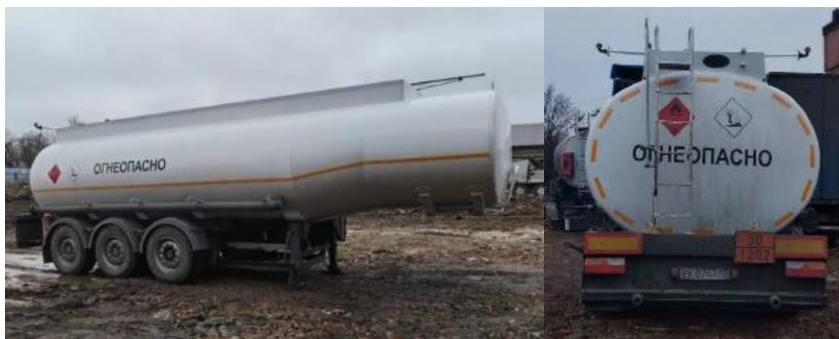
Рисунок 1 – Общий вид ППЦ

Схема пломбировки для защиты от несанкционированного изменения положения уровня налива, обозначение места нанесения знака поверки представлены на рисунке 2.