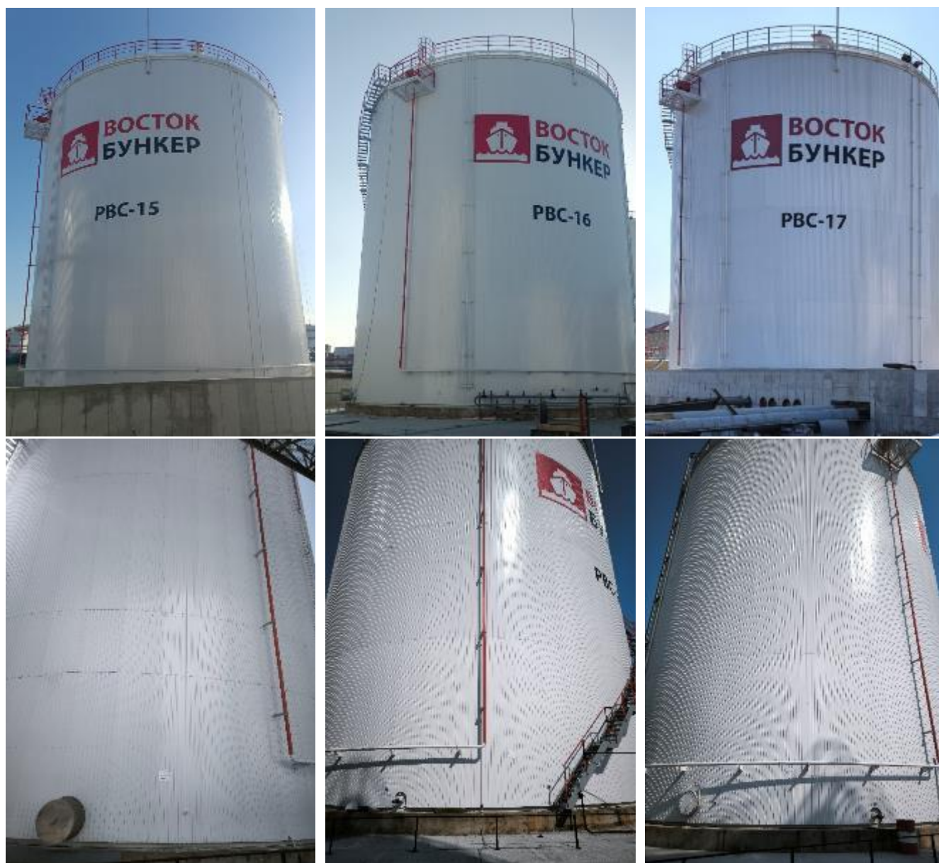
Рисунок 1 – Общий вид резервуаров стальных вертикальных цилиндрических PBC-7500: заводской номер 15 (слева), заводской номер 16 (по центру) и заводской номер 17 (справа)