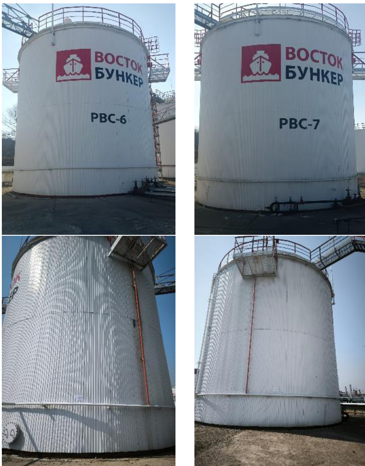
Рисунок 1 – Общий вид резервуаров стальных вертикальных цилиндрических PBC-1000: заводской номер 6 (слева) и заводской номер 7 (справа)