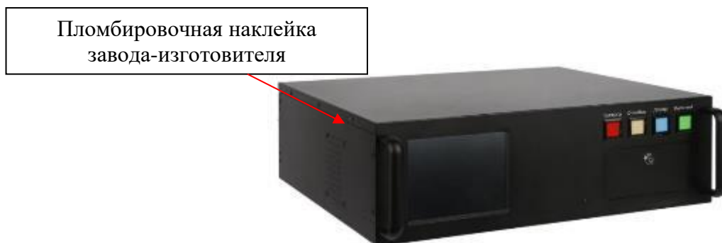
Рисунок 3 – Общий вид центрального блока управления (тип корпуса 03) с указанием места ограничения доступа к местам настройки (регулировки)