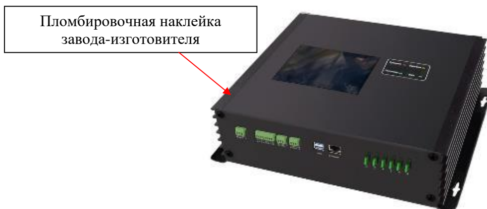
Рисунок 2 – Общий вид центрального блока управления (тип корпуса 02) с указанием места ограничения доступа к местам настройки (регулировки)