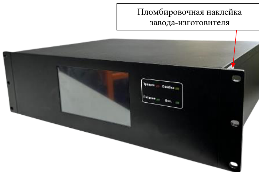
Рисунок 1 – Общий вид центрального блока управления (тип корпуса 01) с указанием места ограничения доступа к местам настройки (регулировки)

Общий вид центрального блока управления с указанием места ограничения доступа к местам настройки (регулировки) представлен на рисунках 1-3. Общий вид места нанесения знака утверждения типа, места нанесения заводского номера представлен на рисунке 4. Способ ограничения доступа к местам настройки (регулировки) – пломбировочная наклейка завода-изготовителя. Нанесение знака поверки на измерители не предусмотрено.