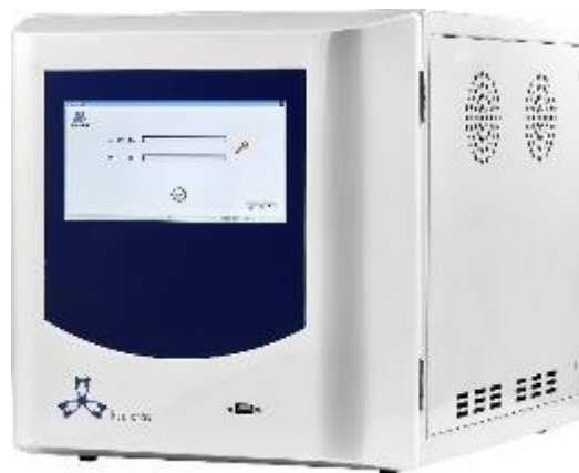
б) анализаторы модели ТА-200