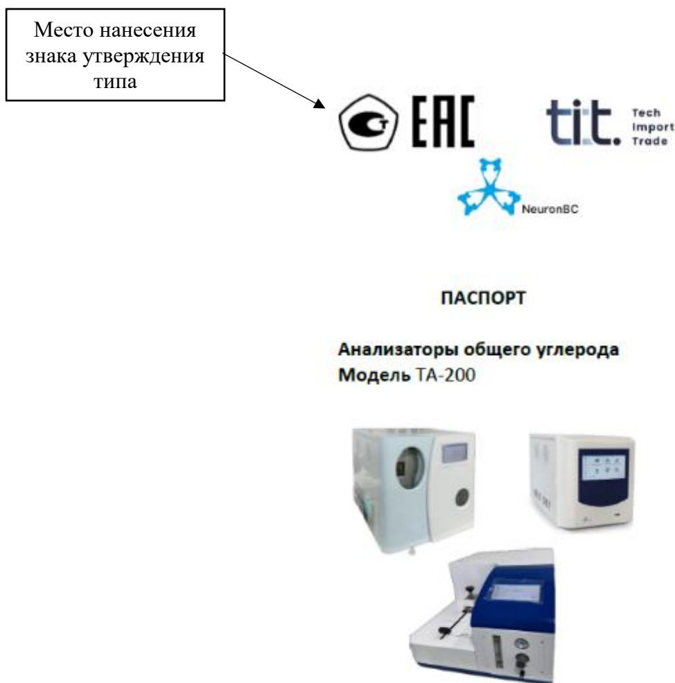
Рисунок 3 – Общий вид титульной страницы паспорта