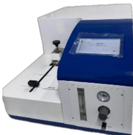
в) анализаторы модели S-300