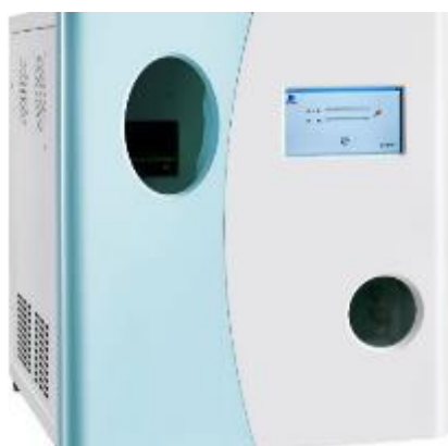
а) анализаторы модели ТА-100

Маркировочная табличка с серийным номером расположена на задней стенке анализатора. Серийный номер имеет буквенно-цифровой формат, наносится типографским способом на клеевую этикетку. Нанесение знака поверки на анализаторы и пломбирование анализаторов не предусмотрено. Общий вид анализаторов представлен на рисунке 1. Общий вид маркировочной таблички с серийным номером представлен на рисунке 2. Общий вид титульной страницы паспорта представлен на рисунке 3.