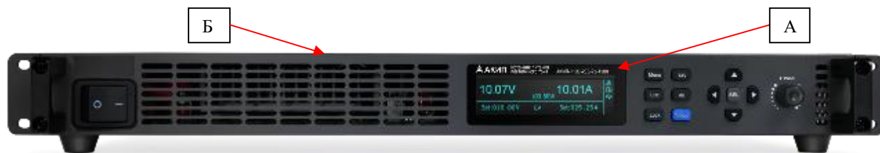
Рисунок 1. Общий вид источников с местом нанесения знака утверждения типа (А) и знака поверки (Б)