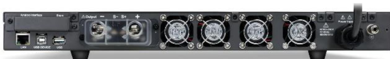
Рисунок 2. Вид задней панели источников