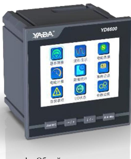
Рисунок 1 – Общий вид анализаторов