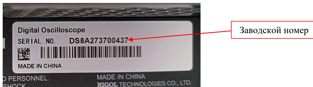
Рисунок 5 – Фрагмент задней панели осциллографов с этикеткой