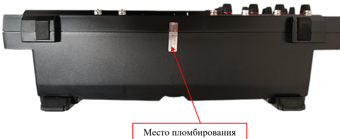
Рисунок 4 – Нижняя панель осциллографов