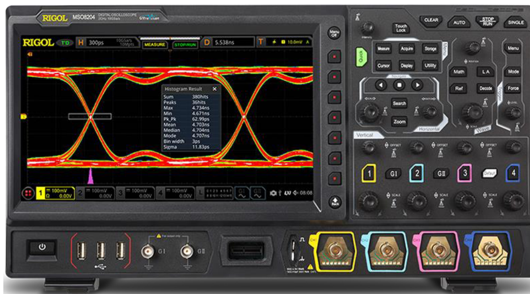
Рисунок 1 – Передняя панель осциллографов

Для предотвращения несанкционированного доступа к внутренним частям осциллографов осуществляется пломбирование стыка панелей корпуса специальными стикер-наклейками (рисунок 4).