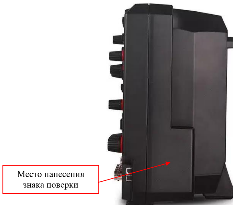
Рисунок 3 – Боковая панель осциллографов