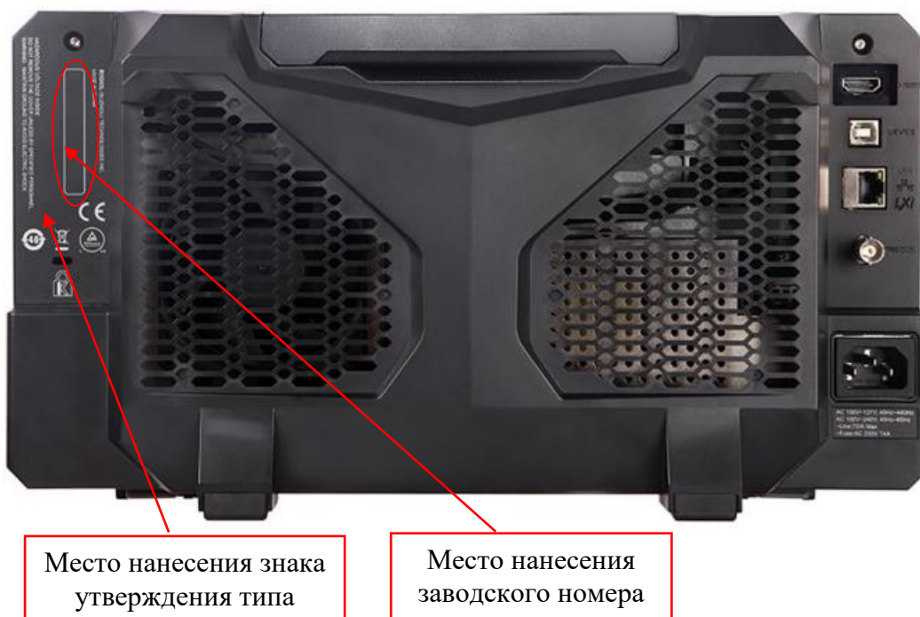
Рисунок 2 – Задняя панель осциллографов