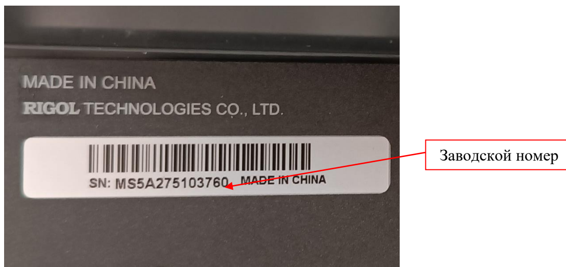
Рисунок 5 – Фрагмент задней панели осциллографов с этикеткой