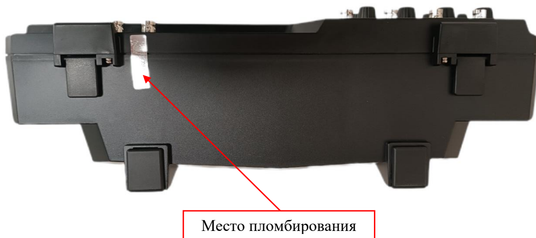
Рисунок 4 – Нижняя панель осциллографов