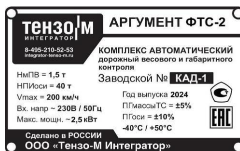
Рисунок 1 – Общий вид маркировочной таблички.

Общий вид маркировочной таблички представлен на рисунке 1.