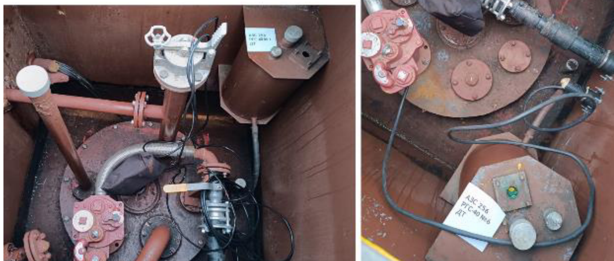
Рисунок 2 – Горловины резервуаров РГС-40 зав.№№ 1, 6

Пломбирование резервуаров РГС-40 не предусмотрено.