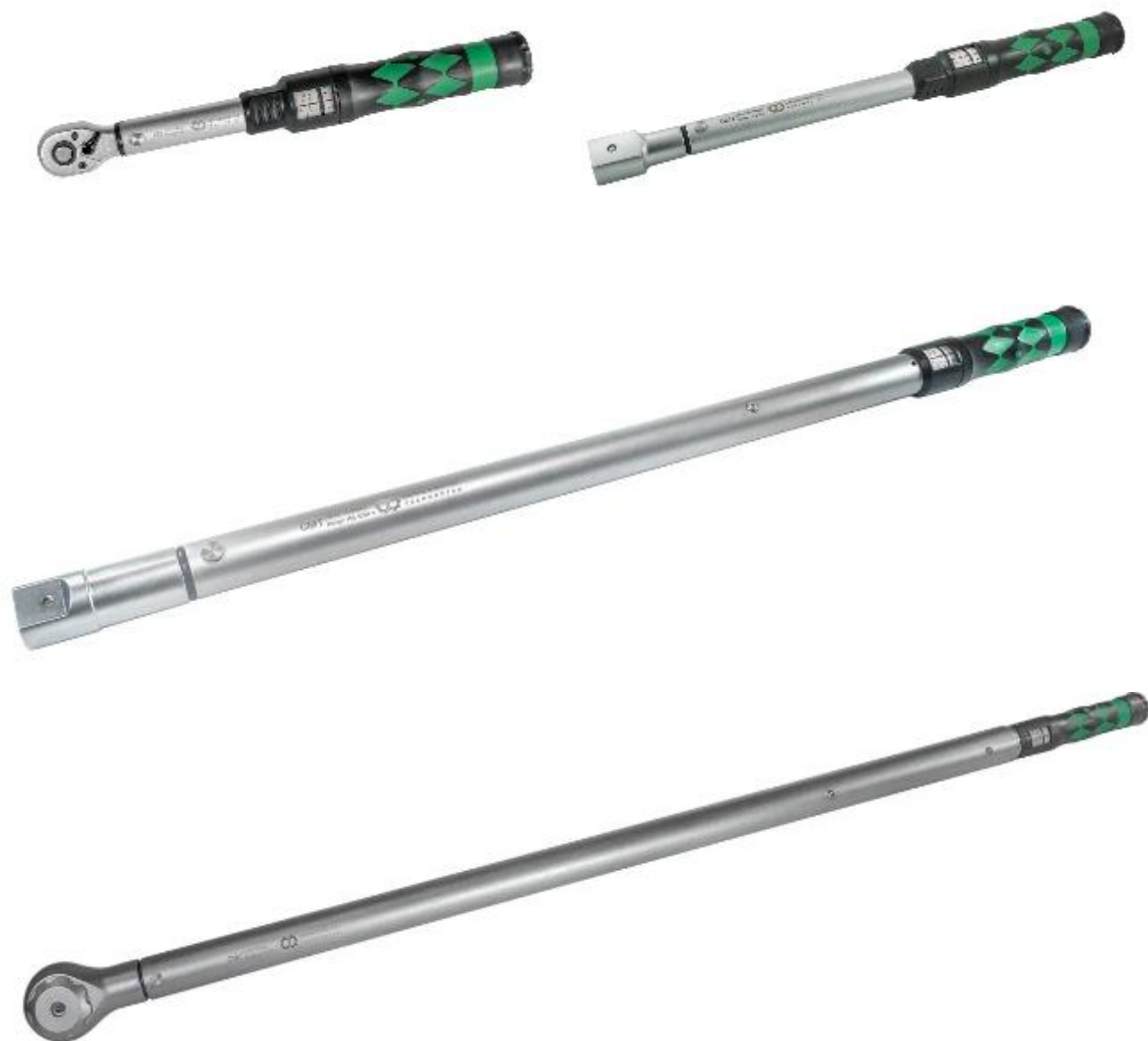
Рисунок 1 – Общий вид ключей моментных предельных СМТS