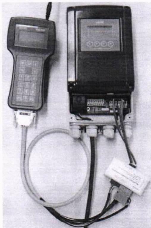
Рисунок Д.1 Устройство MagCheck

Расходомеры-счетчики электромагнитные OPTIFLUX поставляются с преобразователями сигналов IFC 050 / IFC 100 / IFC300. Данные преобразователи сигналов оснащены интерфейсом GDC и могут быть поверены при помощи устройства MagCheck в ручном режиме.