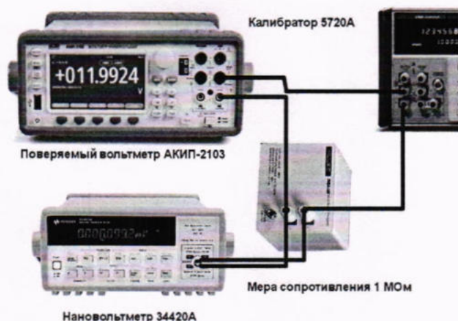
Рисунок 1 – Схема соединения приборов при определении абсолютной погрешности измерения силы постоянного тока

9.3.4 Занести измеренные значения тока поверяемого вольтметра в графу «Показания вольтметра, мкА» таблицы 9. Занести измеренные значения падения напряжения на мере с 34420А в графу «Падение напряжения, В» таблицы 9.