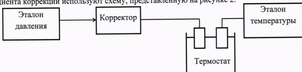
Рисунок 2 – Схема определения относительной погрешности приведения объема газа к стандартным условиям с учетом погрешности измерений давления, температуры и вычисления коэффициента коррекции

Для определения относительной погрешности приведения объема газа к стандартным условиям с учетом погрешности измерений абсолютного давления, температуры и вычисления коэффициента коррекции используют схему, представленную на рисунке 2.