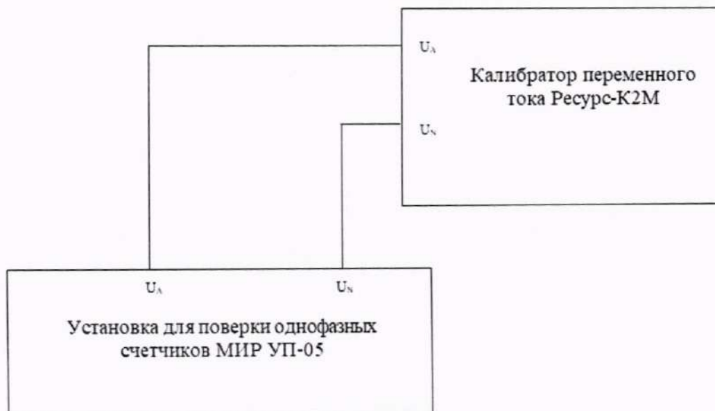
Рисунок 2 – Схема подключения установки к калибратору переменного тока Ресурс-К2М

напряжения во время провала напряжения, длительности перенапряжения \Delta t_{\text{пер}} , длительности провала напряжения \Delta t_{\text{п}} по формуле (2), приведенной в разделе 11.