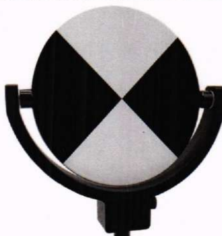
Рисунок 1 – Визирная марка

10.1.3 Установить визирные марки для сканирования (далее – марки) на пункты комплекса (полигона) используемые для измерений в соответствии с требованиями предыдущего пункта, выполнить горизонтирование марок в двух плоскостях, измерить высоту их установки от центра пункта до центра марки с помощью рулетки измерительной. Марка представляет собой изделие в виде круглого рабочего элемента диаметром не менее 150 мм, на передней стороне которого нанесена мишень из сходящегося под 45-градусным наклоном прямоугольного пересечения белых и черных полей, место пересечения которых (центр марки) совмещено с вертикальной осью вращения и установки на пункт, снабжённое соединителем с внутренним крепёжным элементом (резьба 5/8", фитинг), который позволяет устанавливать изделие над центром пункта комплекса или полигона, осуществлять его центрирование и горизонтирование. Располагать марку следует к сканеру таким образом, чтобы плоскость марки с мишенью была перпендикулярна направлению на сканер. Пример марки приведён на рисунке 1.