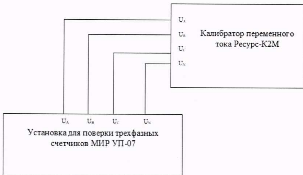
Рисунок 2 – Схема подключения установки к калибратору переменного тока Ресурс-К2М

5) Рассчитать значения абсолютной погрешности измерений максимального напряжения при перенапряжении \delta U_{\text{пер}} , глубины провала напряжения \delta U_{\text{п}} , остаточного напряжения во время провала напряжения, длительности перенапряжения \Delta t_{\text{пер}} , длительности провала напряжения \Delta t_{\text{п}} по формуле (2), приведенной в разделе 11.