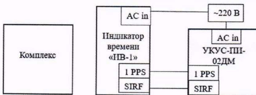
Рисунок 1 – Схема проведения измерений

10.1.2 Обеспечить максимальную радиовидимость сигналов навигационных космических аппаратов ГЛОНАСС в небесной полусфере. В соответствии с ЭД на комплекс и УКУС-ПИ 02ДМ подготовить их к работе. Убедиться в том, что комплекс и УКУС-ПИ 02ДМ синхронизированы со шкалой UTC(SU) (в ПО комплекса отображается время и все светодиодные индикаторы на УКУС-ПИ 02ДМ светятся зеленым цветом).