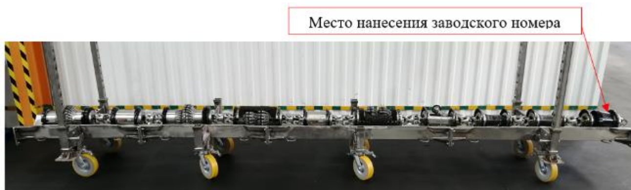
Рисунок 1 – Общий вид исполнения 8-МСК.03-00.000

Общий вид исполнений дефектоскопов приведен на рисунках 1-3.