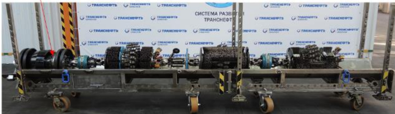
Рисунок 2 – Общий вид исполнения 16-МСК.03-00.000