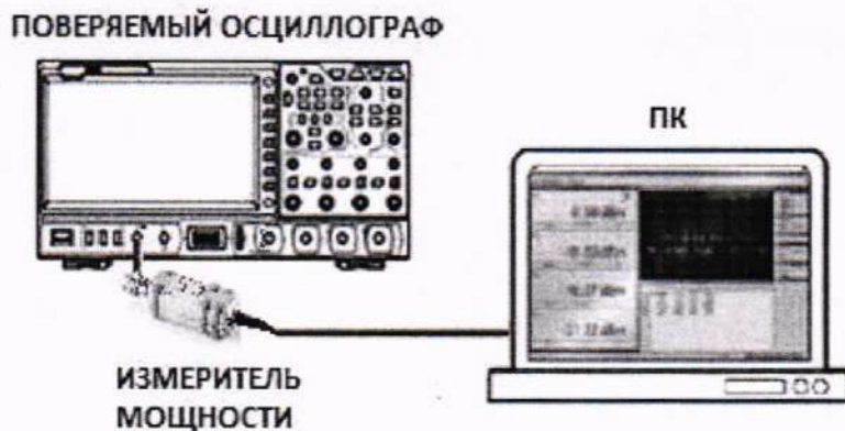
Рисунок 4 – Схема подключения оборудования при определении неравномерности амплитудно-частотной характеристики генератора

10.8.3 Подключить оборудование по схеме, представленной на рисунке 4.