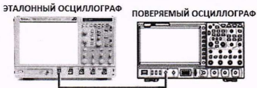
Рисунок 6 – Определение длительности фронта и спада сигнала прямоугольной и импульсной форм

10.10.3 Подключить оборудование по схеме, представленной на рисунке 6.