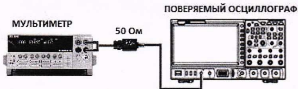
Рисунок 3 – Схема подключения оборудования для определения абсолютной погрешности установки уровня синусоидального сигнала генератора

10.7.3 Подключить оборудование по схеме, представленной на рисунке 3.