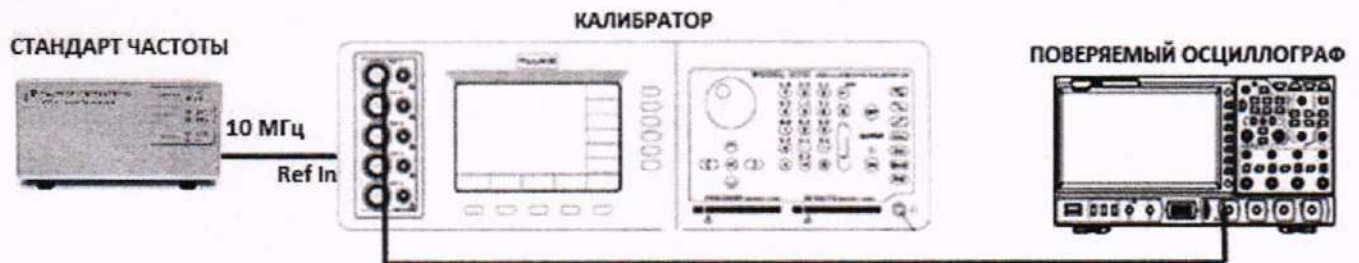
Рисунок 2 – Схема подключения оборудования для определения полосы пропускания, абсолютной погрешности измерения временных интервалов

10.5.3 Установить на калибраторе 9500В режим воспроизведения переменного напряжения на нагрузку 1 МОм.