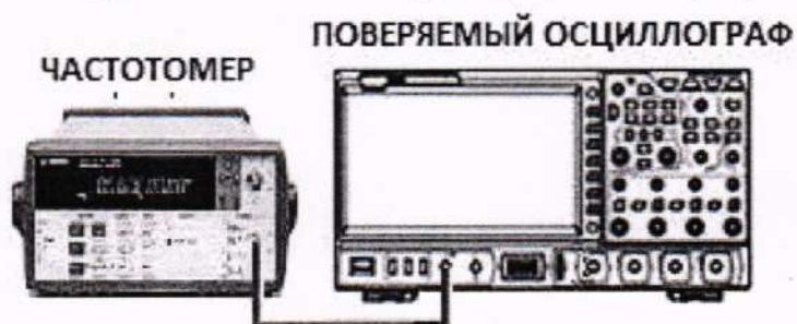
Рисунок 5 – Схема подключения оборудования при определении относительной погрешности установки частоты выходного сигнала генератора

10.9.2 Подключить оборудование по схеме, представленной на рисунке 5.