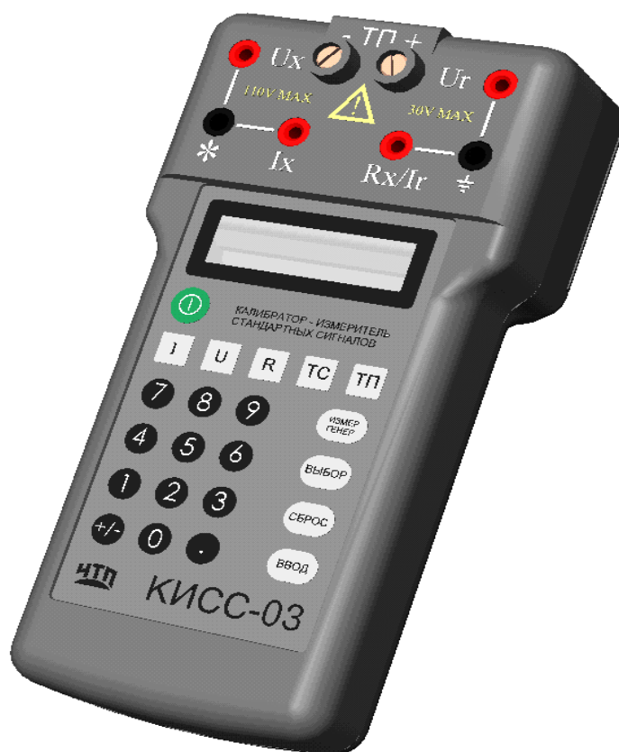
Рисунок 1 – Фотография общего вида

Схема пломбировки от несанкционированного доступа представлена на рисунке 2.