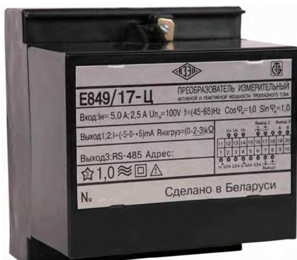
Рисунок 1 - Общий вид преобразователя Е849-Ц