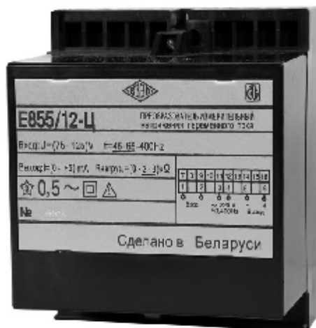
Рисунок 1 – Внешний вид преобразователя Е855-Ц

На рисунке 2 указана схема указания мест расположения клейма ОТК и клейма (наклейки) поверителя на преобразователе Е855-Ц.