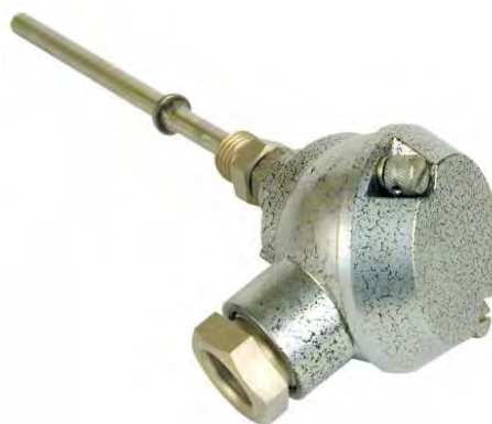
Рисунок 1. - Общий вид термопреобразователя сопротивления «ВЗЛЕТ ТПС»

Для защиты от несанкционированного доступа должен быть опломбирован винт крепления крышки корпуса изделия в соответствии с рисунке 2.