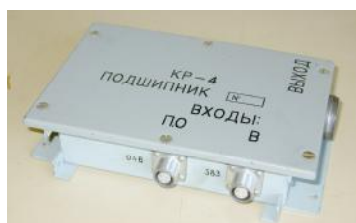
Рисунок 4 - Преобразователь КР-4

Внешний вид преобразователя КР-4 представлен на рисунке 4.