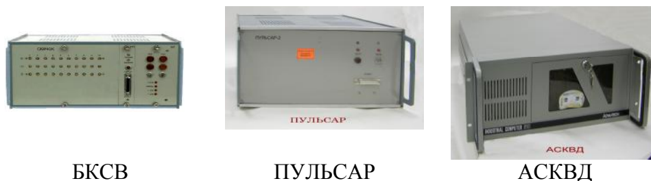
Рисунок 10 - Блок контроля скачка вибрации БКСВ, модуль многоканального регистратора ПУЛЬСАР и контроллер АСКВД.

Внешний вид блока контроля скачка вибрации БКСВ, модуля многоканального регистратора ПУЛЬСАР и контроллера АСКВД представлен на рисунке 10.