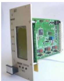
Рисунок 8 - Блок измерения и контроля микропроцессорного канала (БКО) (измерительный блок БКО)

Внешний вид блока измерения и контроля микропроцессорного канала (БКО) (измерительного блока БКО) представлен на рисунке 8.