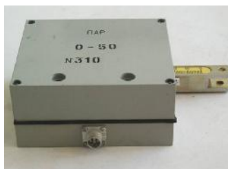
Рисунок 6 - Вихретоковый преобразователь ПАР

Внешний вид измерительных блоков представлен на рисунке 7.