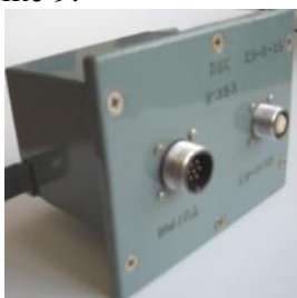
Рисунок 9 - Вторичные преобразователи ПОС, ПОР, ПОВ, ПТ и ПУ.

Внешний вид вторичных преобразователей ПОС, ПОР, ПОВ, ПТ и ПУ представлен на рисунке 9.