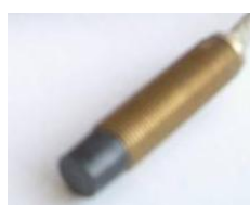
КВ-1650 КВ-1025 КВ-1225

Внешний вид вихретоковых датчиков представлен на рисунке 5.