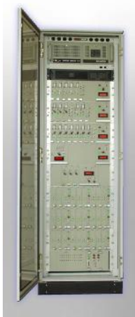
Рисунок 1 - Аппаратура «СИВОК»

Внешний вид аппаратуры «СИВОК» представлен на рисунке 1, структурная схема представлена на рисунке 2.