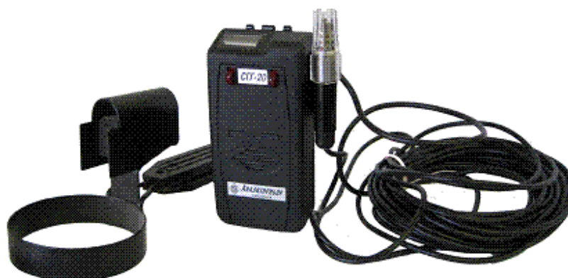
Фото 3 – Внешний вид сигнализаторов СГГ-20-03К с БД на кабеле длиной 1,5 м с приспособлением для контроля содержания горючих газов и паров в баллонах

Схема пломбировки от несанкционированного доступа и обозначение мест для нанесения оттисков клеем приведена на рисунке 2.