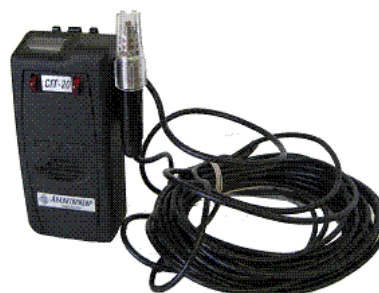
Фото 2 – Внешний вид сигнализаторов СГГ-20-01, СГГ-20-01М, СГГ-20-02, СГГ-20-02Н, СГГ-20-02М с БД на кабеле от 1 до 10 м