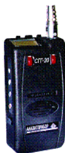
Фото 1 – Внешний вид сигнализаторов СГГ-20, СГГ-20Н, СГГ-20М, СГГ-20Р со встроенным ТХД

Внешний вид сигнализаторов показан на фото 1-3.