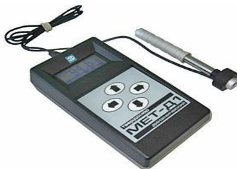
Рисунок 1 – Внешний вид твердомера МЕТ-Д1

Внешний вид твердомера МЕТ-Д1 приведён на рисунке 1, схема пломбировки от несанкционированного доступа на рисунке 2.