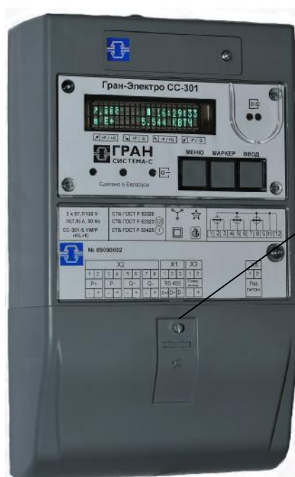
Рисунок 3 – Внешний вид счетчиков электрической энергии модификации «Гран-Электро СС-301-Х.ХХХХ(К)» и место пломбирования энергоснабжающей организации