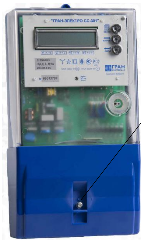
Рисунок 2 – Внешний вид счетчиков электрической энергии модификации «Гран-Электро СС-301-Х.ХХХХ» и место пломбирования энергоснабжающей организации