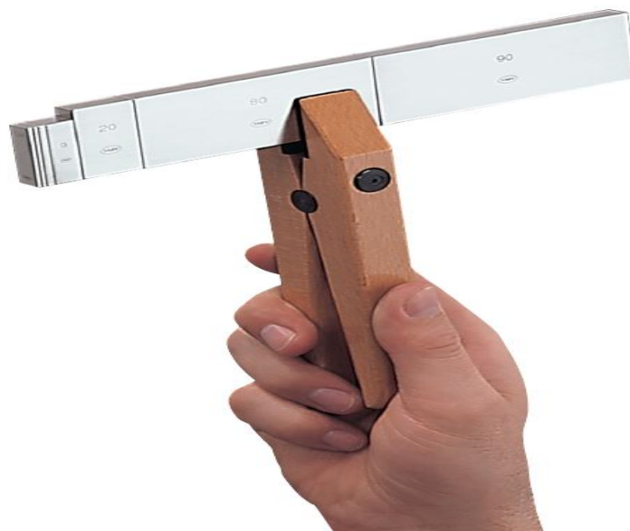
Рисунок 2 – Притертый блок концевых мер