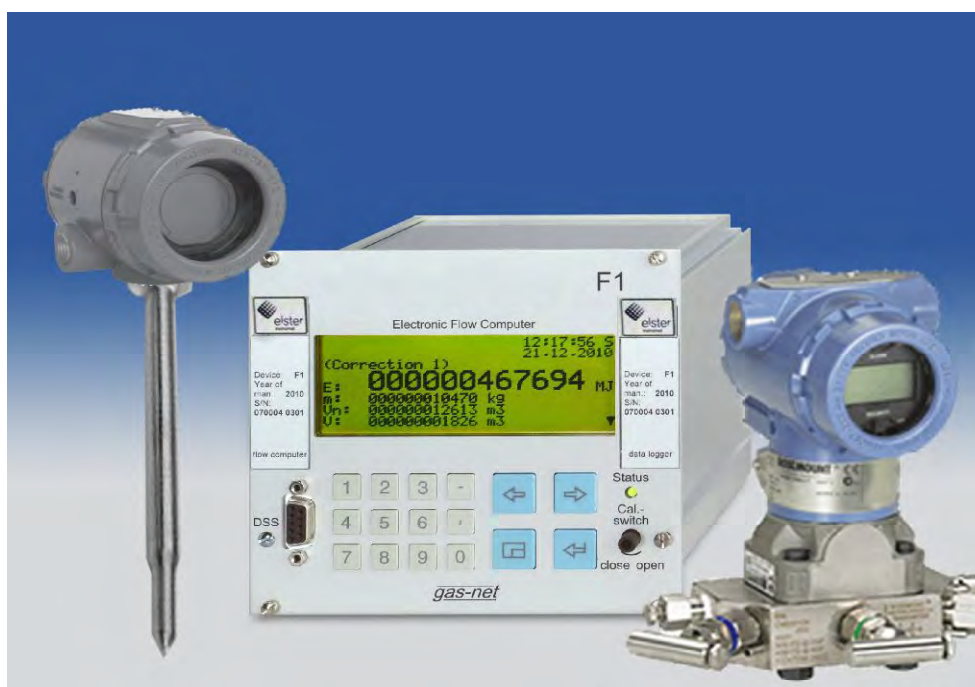
Фото корректора и место пломбирования приведены ниже.