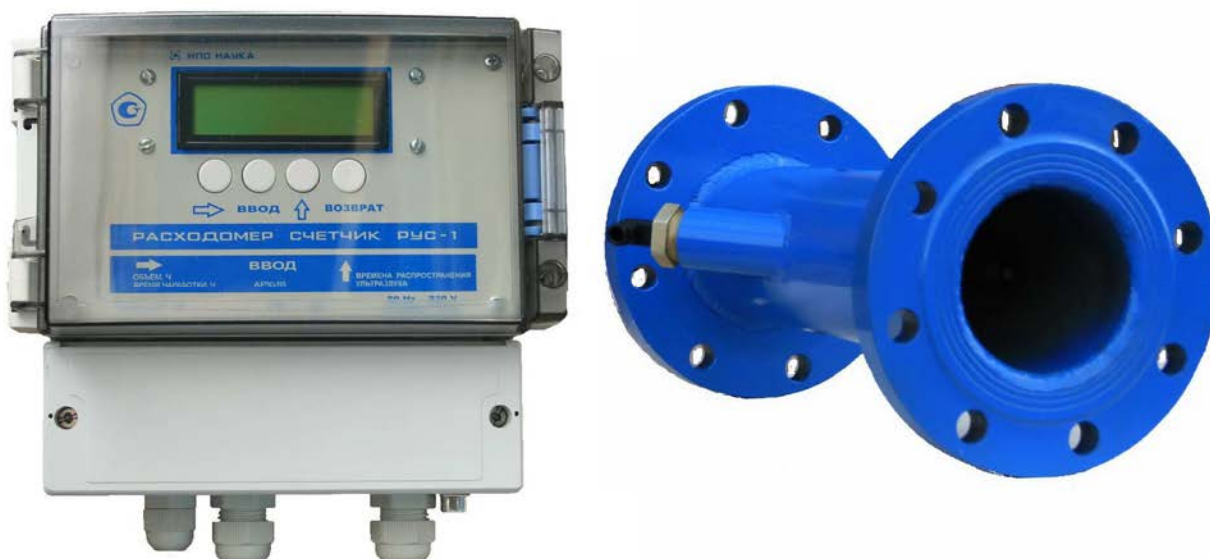
Рисунок 1 - Общий вид расходомеров-счетчиков ультразвуковых РУС-1

Общий вид приборов приведен на рисунке 1.