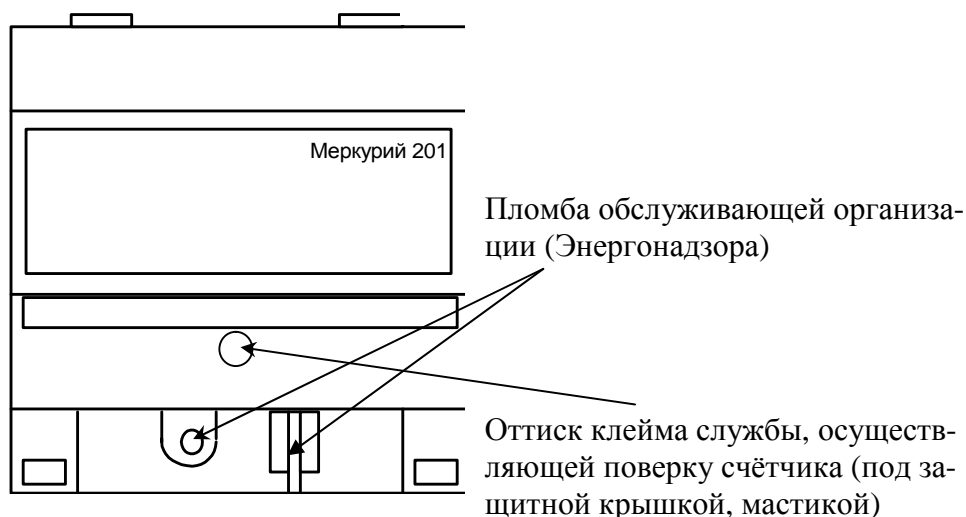
Рисунок 6 - Схема пломбирования счётчиков «Меркурий 201.1», «Меркурий 201.2», «Меркурий 201.22», «Меркурий 201.3», «Меркурий 201.4», «Меркурий 201.42», «Меркурий 201.5», «Меркурий 201.6»