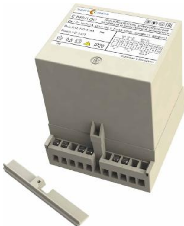
Рисунок 1 – Общий вид Е 849ЭС

Схема пломбировки от несанкционированного доступа и указание мест для нанесения знака поверки средств измерений на преобразователи приведены на рисунке 2.