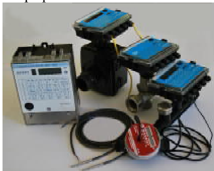
Рис. 1 Теплосчетчик "КСТ-22 ДУЭТ (ДУЭТ-С) РМД"

Фотографии теплосчетчиков и их основных узлов приведены на рис. 1...7.