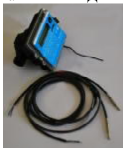
Рис. 6 Теплосчетчик "КСТ-22 Комбик – М", "КСТ-22 Комбик – М РМД"