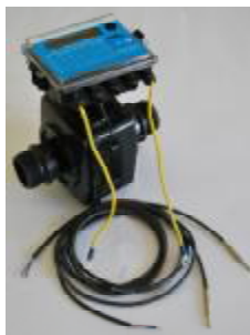
Рис. 4 Теплосчетчик "КСТ-22 Компакт – ЭР РМД"