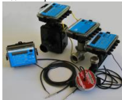
Рис. 2 Теплосчетчик "КСТ-22 ПРИМА (ПРИМА-С) РМД"