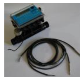
Рис. 5 Теплосчетчик "КСТ-22 Компакт – УР РМД"