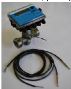
Рис. 3 Теплосчетчик "КСТ-22 Компакт – ВР РМД"