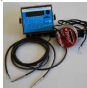
Рис. 7 Теплосчетчик "КСТ-22 Комбик – В"