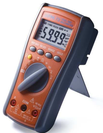
Рисунок 1 Фотография общего вида мультиметров

Отличие модификаций мультиметров заключается в различных функциональных возможностях и технических характеристиках.