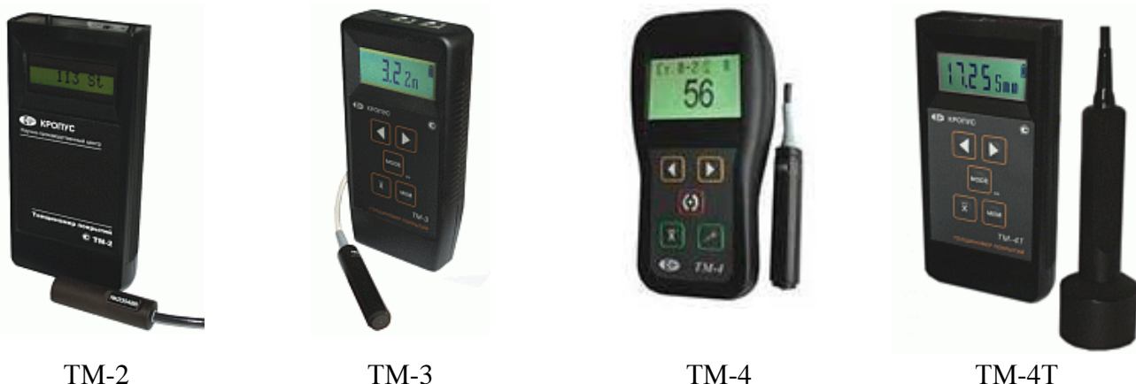
Рисунок 1 – Общий вид толщиномеров покрытий

Фотографии общего вида толщиномеров покрытий представлены на рисунке 1.