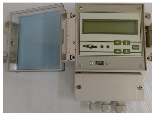
б) Блок обработки информации БОИ-4