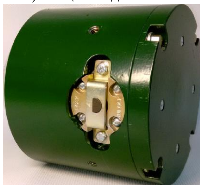
в) Кассета типа СН с излучателем натрий-22