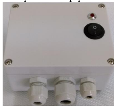
г) Блок питания БП-2