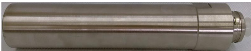
д) Блок детектирования БД-6-1 или БД-6-5