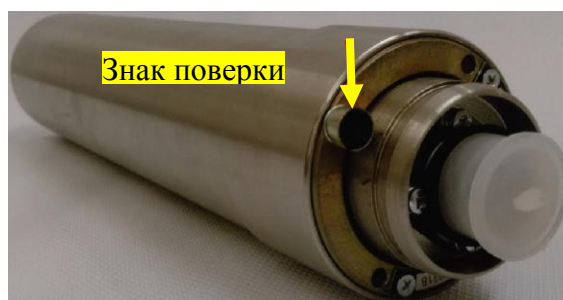
а) Блок детектирования БД-6-1, БД-6-1Д, БД-6-5, БД-6-5Д