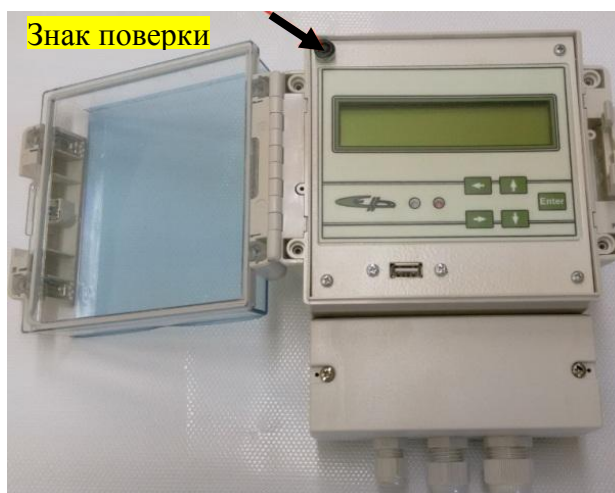
в) Блок обработки информации БОИ-4