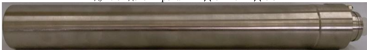
е) Блок детектирования БД-6-1Д или БД-6-5Д