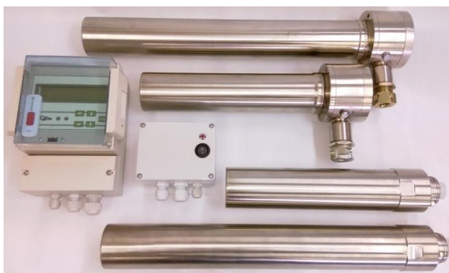
а) Общий вид ИУБ-1К

Схема пломбировки от несанкционированного доступа, обозначение места нанесения знака поверки представлены на рисунке 2.