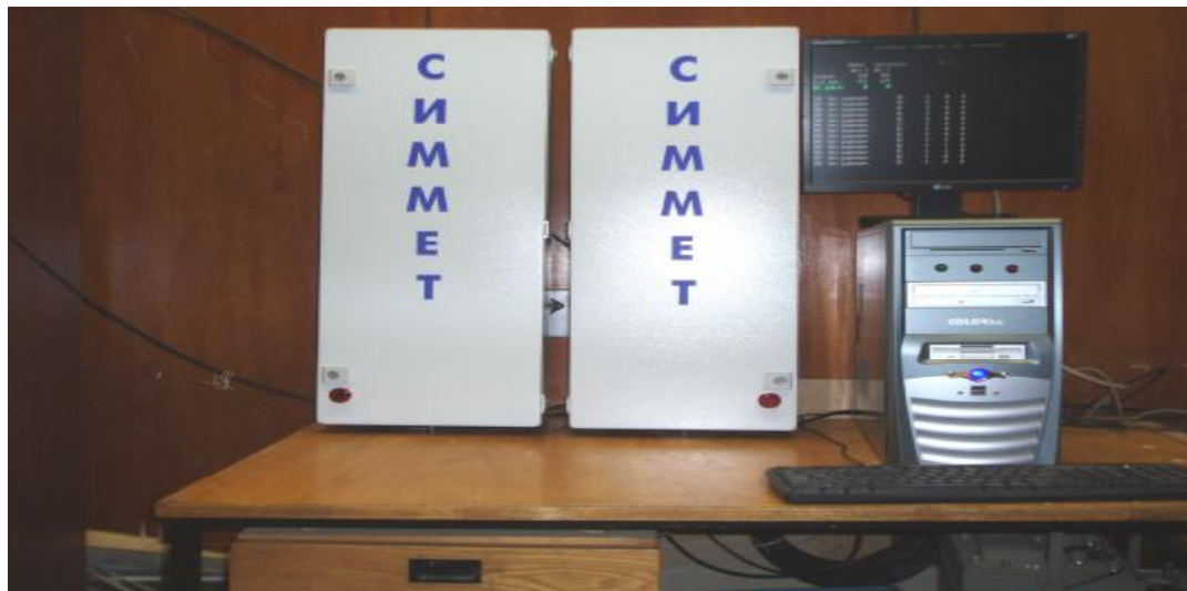
Рисунок 1 – Система дозиметрического контроля ДБГ-УРКТ «СИММЕТ»

Внешний вид «СИММЕТ» и места пломбировки приведен на рисунках 1 и 2.