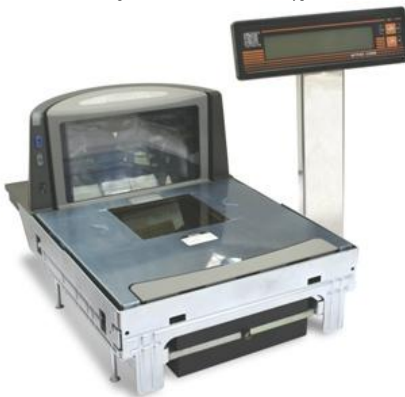
Рисунок 1. Общий вид весов Штрих ВМ 100.

Конструктивно весы состоят из грузоприемного, весоизмерительного устройства и закрепленного на стойке дисплея со встроенным блоком клавиатуры.